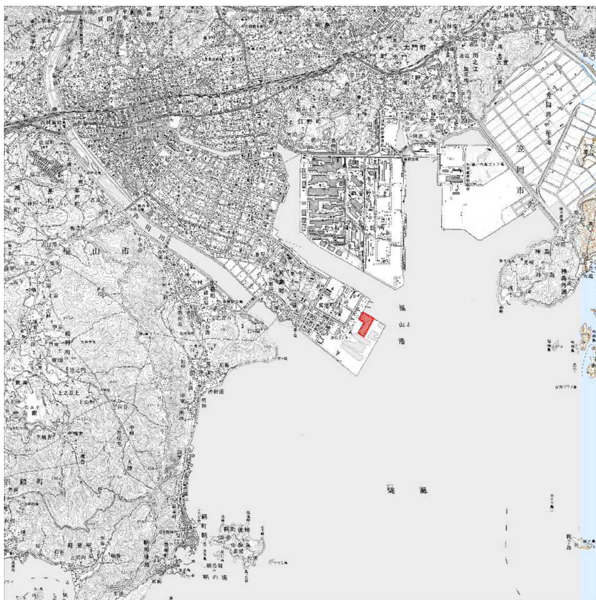
建設予定地位置図 (1/100,000)